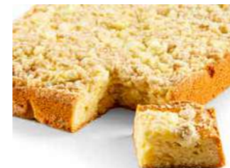
Omenapiirakka 1250 g

Kespro 21332267 Valio Aimo Metro Valikoimissa Meiranova Patu 116580