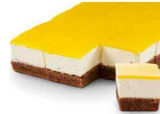
Mangojuusto-levykakku 2250 g