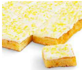
Sitruunalevypiirakka 1250 g

Kespro 21640115 Valio Aimo 8070202 Metro 3214749 Meiranova Patu 125263