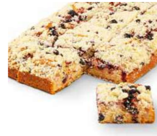
Mansikka-mustaherukka-piirakka 1250 g