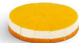
Mangojuustokakku 1400 g

Kespro 21679204 Valio Aimo 8075240 Metro Valikoimissa Meiranova 1006759 Patu Valikoimissa