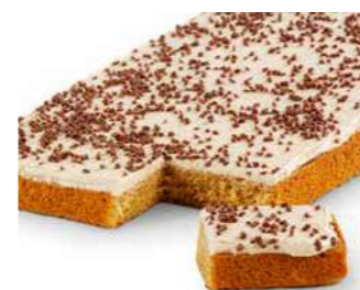
Kinuskipiiirakka 1250 g

Kespro 22035868 Valio Aimo 8091413 Metro Valikoimissa Meiranova 1007881 Patu 139513