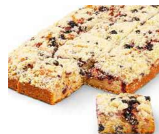
Mansikka-mustaherukka-piiirakka 1250 g

Kespro 21858946 Valio Aimo 8082615 Metro Valikoimissa Meiranova Valikoimissa Patu 132505