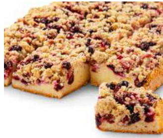
Mustaherukka-raparperipiirakka 1350 g