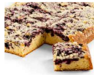
Mustikkapiirakka, paloitetu 1250 g

Kespro 21028545 Valio Aimo 800896 Metro 800896 Meiranova 1074092 Patu 103941