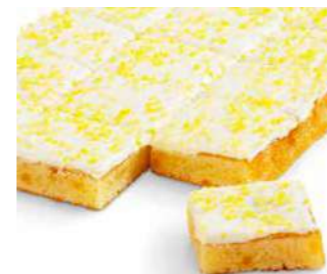
Sitruunalevypiiirakka 1250 g

Kespro 21914755 Valio Aimo 8086124 Metro Valikoimissa Meiranova Patu 133940