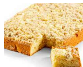
Omenapiirakka, paloitetu 1250 g

Kespro 21310648 Valio Aimo 552729 Metro 552729 Meiranova 1074541 Patu 103942