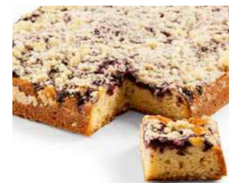
Mustikkapiirakka 1250 g

Kespro 22035868 Valio Aimo 8091413 Metro Valikoimissa Meiranova 1007881 Patu 139513